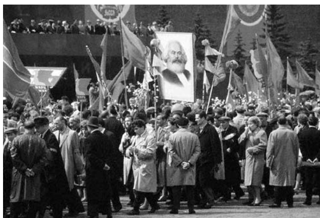
Так массово и празднично проходила демонстрация на Красной площади в Москве в 1964 году.

отпраздновали открыто: миллионы рабочих вышли на улицы с лозунгами «Долой министров-капиталистов», «Вся власть Советам», «Долой империалистическую войну!».